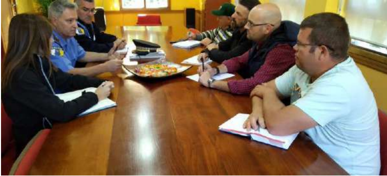
JUNTA DE SEGURIDAD Y EMERGENCIAS. CABALGATA DE REYES 2020.

Los Reyes llegan al Parque de los Moros. Preguntan a un grupo de pastores por el lugar donde Jesús nació. Terminada la escena, hebreas y pastores engrosan el cortejo real y parten al Palacio de Herodes.