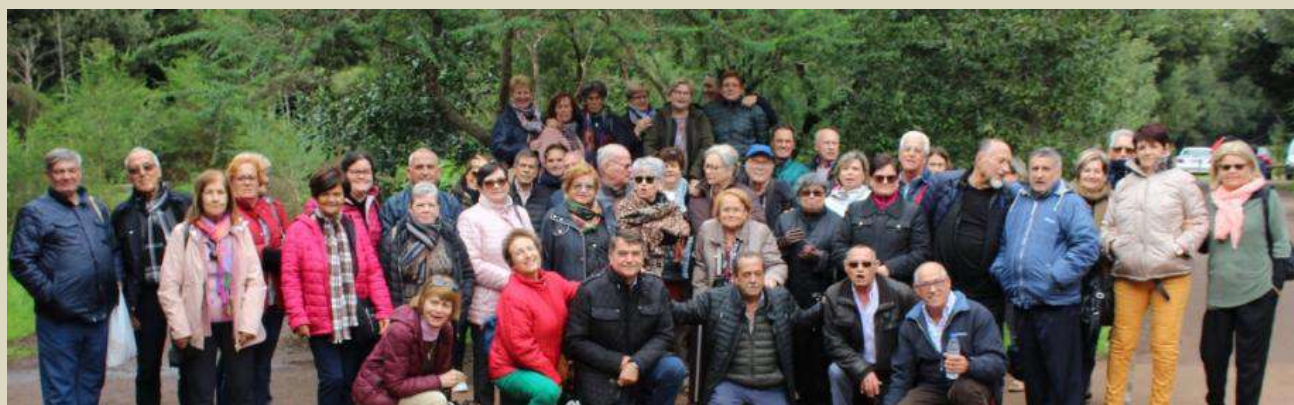
TRES DÍAS EN LA GOMERA