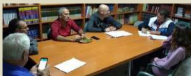
Comisión Redactora Reglamento Cabalgata.

La Cabalgata de Reyes, sin duda el evento más sugerente de la navidad agüimense, es un acto pensado para los niños. Porque son los niños los destinatarios de pero también son muchos los niños que participan como figurantes en este acto. Por ello, para armonizar los criterios que regirán la elección de los aspirantes a ocupar plazas en la cabalgata, hemos nombrado una comisión de trabajo con la pretensión de normalizar la los criterios de cada sector. Así pues, este sencillo reglamento, servirá para: