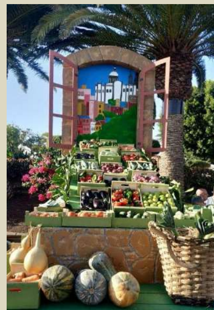
MOTIVO CARRETA ROMERÍA DEL ROSARIO 2019.

El día 5 de octubre, como de costumbre, nuestra Asociación participó en la Romería-Ofrenda del Rosario con la original alegoría titulada “Remanso de sueños y alma de romería”. Agradecemos, además, nuestra satisfacción por la gran cantidad de alimentos recogidos.