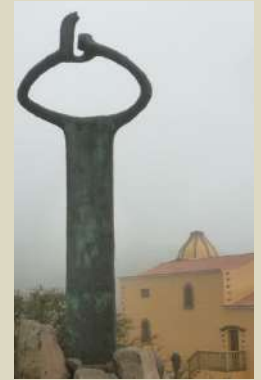
Monumento al Silbo Gomero