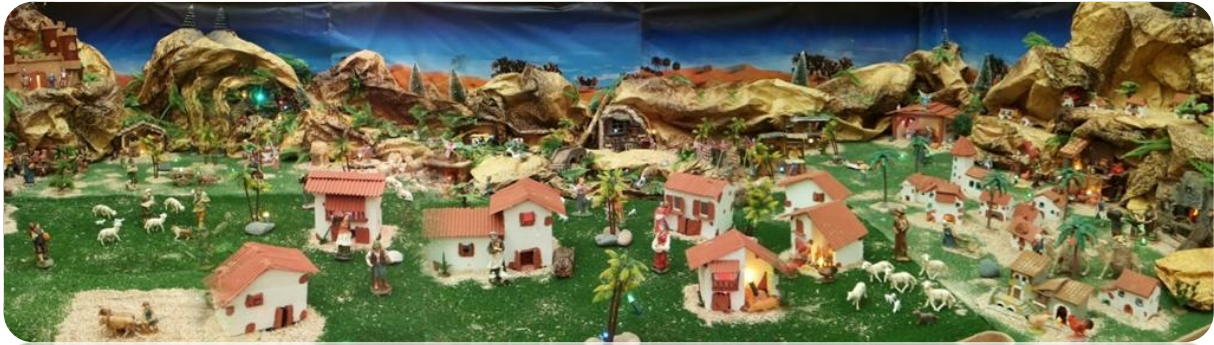
Uno de los belenes participantes.

Así mismo recordamos el alto número de participantes en el Certamen de Belenes que cada año, coincidiendo con las fiestas navideñas, convoca la Asociación. A los niños y niñas participantes se les reconoce el gesto con un diploma acreditativo y se les obsequia con algunos regalos cedidos por empresas y particulares.