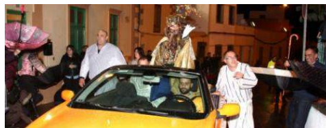
Este año los reyes llegaron en coche.

A principios de año, como cada cinco de enero, se puso en escena una actividad con 61 años de historia: la Magna Cabalgata de Reyes -Auto de los Reyes Magos-. Este año, esta representación teatral al aire libre, basada en un libreto original de Orlando Hernández Martín, sufrió una profunda alteración debido a las sinrazones del tiempo.