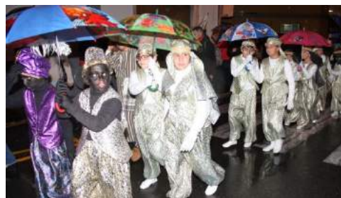
Participantes Cabalgata de Reyes 2016

Habitualmente, la Comitiva Real sale desde los jardines del Colegio Nuestra Señora del Rosario para, tras visitar cinco escenarios distribuidos por varios puntos del pueblo, finalizar en la Plaza Nuestra Señora del Rosario. Este año sólo se pudo realizar esta última escena. No obstante las dificultades impuestas por la climatología, la plaza se llenó en un instante de pequeños y mayores que, guarecidos bajo un bosque de paraguas, rompieron en sonora ovación. Un sentido aplauso para premiar el esfuerzo de cientos de voluntarios que apostaron por mantener viva esta vieja tradición a pesar de la las adversidades atmosféricas.