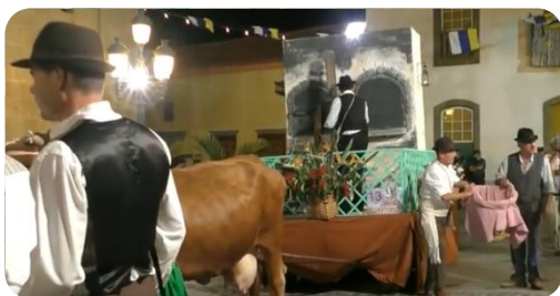
Carroza de La Salle. Romería 2016

A finales de septiembre, como hacemos habitualmente, nuestra Asociación participó con una carroza en la Romería-Ofrenda del Rosario. Al día siguiente, fiesta principal, la Agrupación Musical y Majorettes participaron en la procesión de la Patrona, al tiempo que las Mujeres de la Asociación la acompañaban luciendo la típica mantilla canaria.