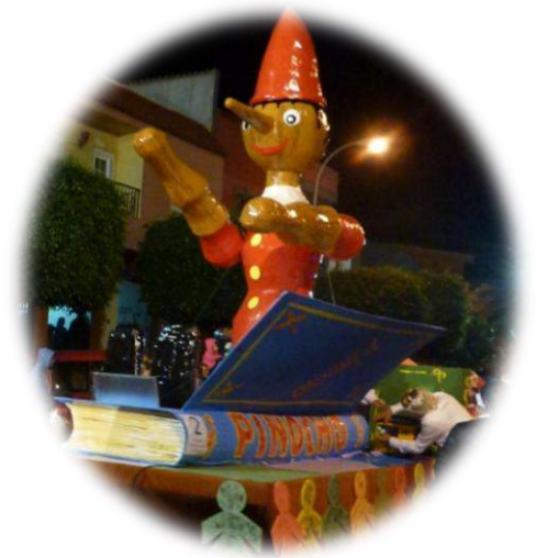
Carroza del Carnaval 2016

En el mes de febrero, la Asociación participó en la tradicional Cabalgata de Carnaval de Agüimes mediante la confección de una carroza para el desfile inaugural y para el Entierro de la Sardina.