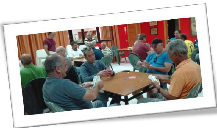
Local Social. Campeonato de Zanga.

A mediados de mayo (sábado, 15) celebramos los actos en honor a San Juan Bautista de La Salle, patrono de la Asociación. Esta efeméride comenzó con un acto litúrgico a cargo del párroco a la que siguió, acompañada por la