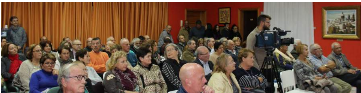
Vista parcial del Salón de Actos.

Tradicionalmente, llegadas estas fechas, nuestra Asociación prepara un acto para proclamar que la gran Fiesta de la Navidad ya está con nosotros y que la Magna Cabalgata de Reyes está esperando a que le abramos la puerta.