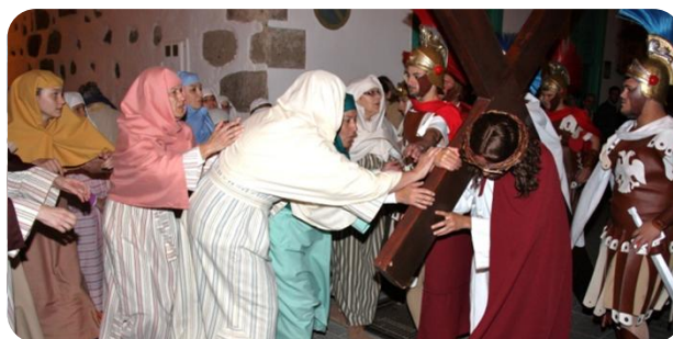
... Y era el Hijo del Hombre... Auto de la Pasión.

Esta obra se interpreta en tres escenarios. En el primero de ellos, el Parque de los Moros , se desarrollan las escenas de la Curación del ciego de Jericó, la Entrevista del ciego con los Sanedrines, el Encuentro de Jesús con sus discípulos y la Entrada triunfal en Jerusalén.