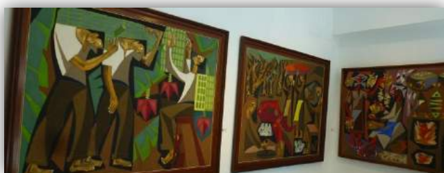
Museo Antonio Padrón. Gáldar.

El día 2 de mayo, en la jornada de mañana, visitamos el Museo y Parque Arqueológico Cueva Pintada, uno de los yacimientos arqueológicos más singulares de la isla de Gran Canaria. Una experiencia excelente que nos desvela el modus vivendi y la estructura organizativa de los aborígenes, nuestros antepasados, y nos descubre detalles reveladores sobre la incorporación de Canarias a los anales de la historia. Por la tarde hicimos un recorrido por las salas de la Casa-Museo Antonio Padrón. Aquí pudimos disfrutar de la singular visión de la naturaleza insular que atesoraba el pintor y descubrir esa sugerente interpretación de la realidad social