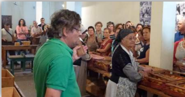
Almacén de Empaquetado del Tomate.

El sábado 21 de noviembre visitamos la Aldea de San Nicolás de Tolentino. Allí tuvimos la oportunidad de recorrer sus calles y visitar todas y cada uno de las dependencias en las que se han ido recopilando la memoria viva de un pueblo: el Almacén de Empaquetado del Tomate (que luego complementamos con la visita a