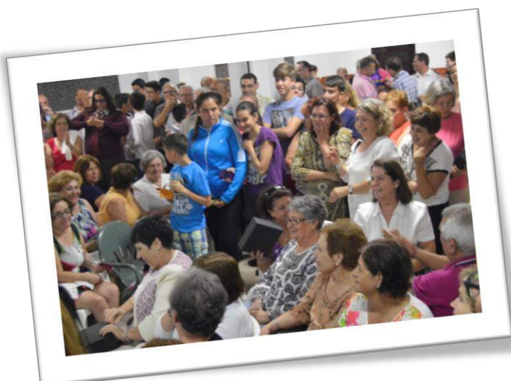
Local Social. Fiesta de S. Juan Bautista de La Salle.