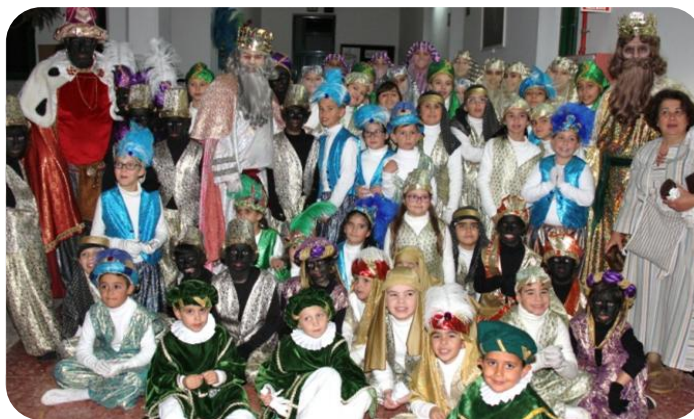
Participantes Cabalgata de Reyes 2015

A principios de año, como cada cinco de enero, programamos y pusimos en escena una actividad que se viene desarrollando desde 1956: la Magna Cabalgata de Reyes -Auto de los Reyes Magos-. Es esta una representación teatral al aire libre basada en un libreto original de Orlando Hernández Martín, afamado escritor nacido en Agüimes en 1936.