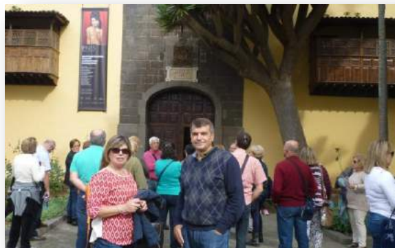
En el Instituto de Canarias. La Laguna.

El pasado día cinco de diciembre iniciamos una visita de tres días a la isla de Tenerife con el objetivo de combinar cultura, gastronomía, entorno natural y disfrute del tiempo libre. En resumen, una actividad para aprender y para disfrutar. Recorrimos los pueblos del norte, desde La Laguna hasta Garachico. Merece destacar la amabilidad de la gente así como el buen ambiente y la armonía reinante entre los participantes. Especial mención merece Garachico y su Ayuntamiento, que puso a nuestra disposición una guía local que nos hizo una magnífica reseña geográfica e histórica de la Villa y Puerto. Nuestro sincero agradecimiento desde estas páginas.