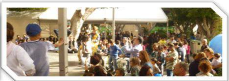
Plaza de Nuestra Señora del Rosario. Visita del Paje Real.

El Enviado Regio de Sus Majestades los Reyes Magos de Oriente visitó la Plaza de Nuestra Señora del Rosario el pasado 27 de diciembre. Además de recoger las cartas de los pequeños asistentes reunía cientos de juguetes que servirían para ayudar a familias necesitadas del municipio en esa noche tan especial: la noche de Reyes.