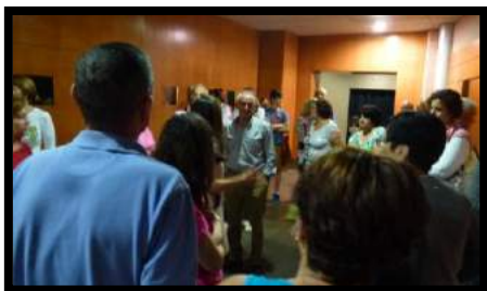
Cueva Pintada. Gáldar.